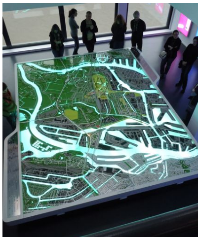
Maquette IBA Dock © gilles garby