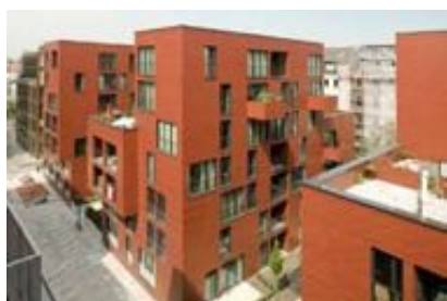
Hopfenstrasse, baufeld 2, logements, Jörg, Friedrich+Partner architectes, 2008