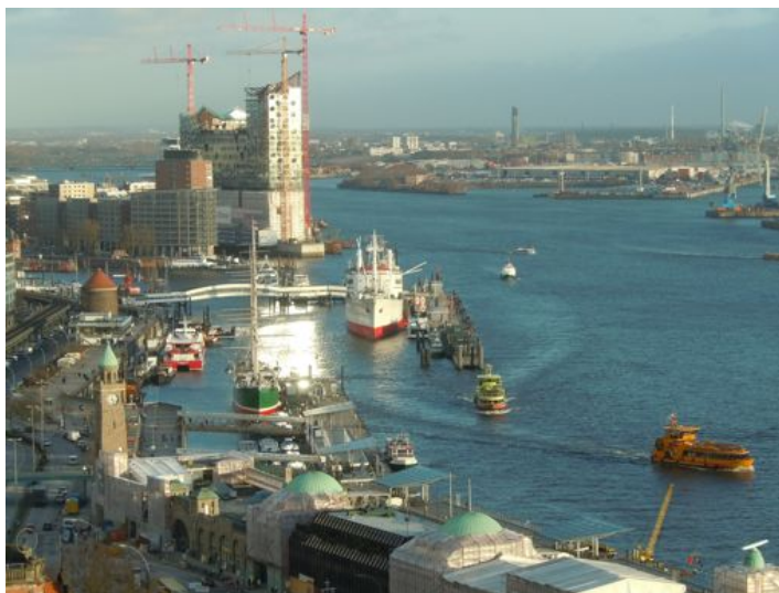
Hambourg, ville-port